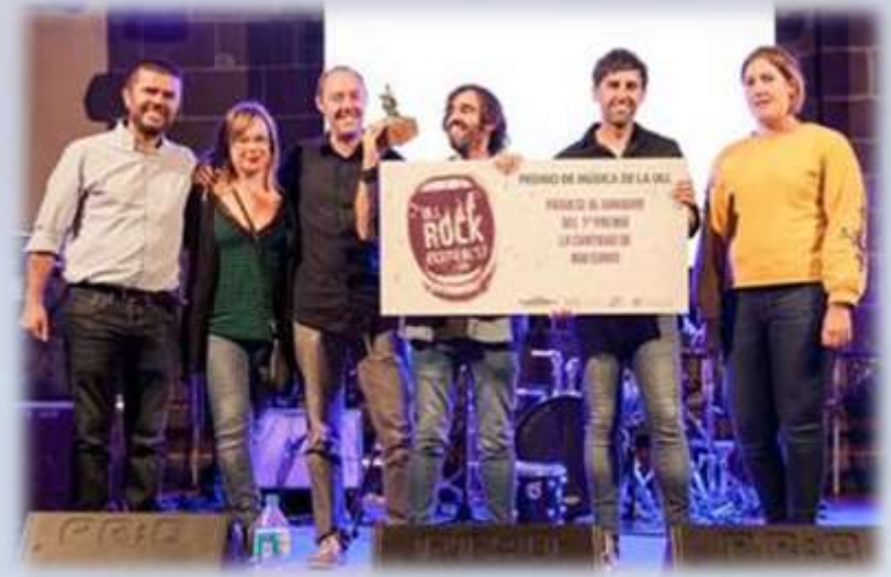
Sumergible gana el Festival ULL Rock