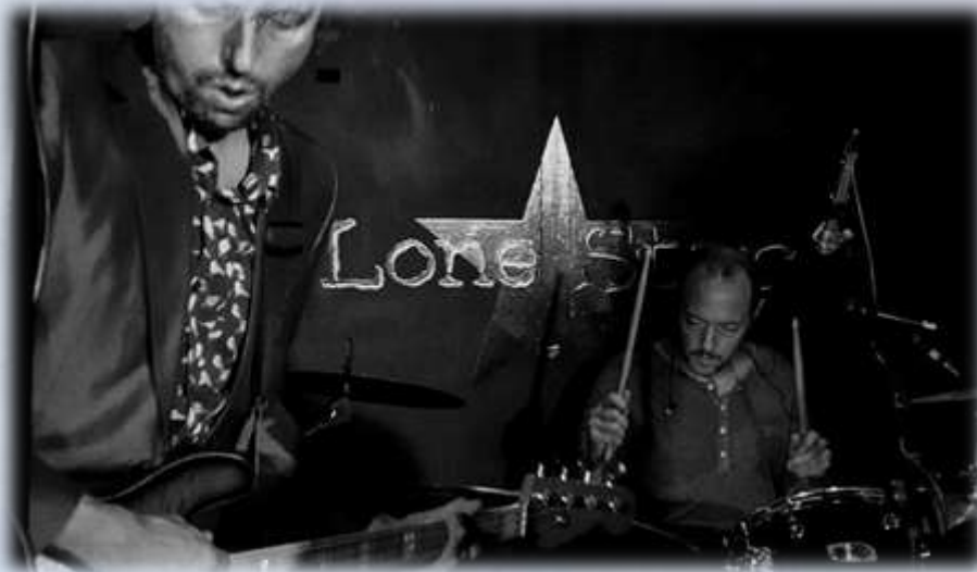
Sumergible en el Lone Star (Santa Cruz)