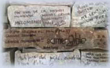
Estudios Sonobox (Madrid)

Sumergible se constituye en 2011 comenzando a trabajar casi de inmediato en un material propio que pronto cristaliza en la primera grabación autoeditada de la banda (Sumergible, 2013). Bajo la dirección de Oscar Bennasar, el grupo explora sus influencias y concreta un estilo original y definido que sirve de base para el primer y por el momento único álbum oficial del grupo. Tras contactar a principios de 2016 con el productor Manuel Colmenero (Vetusta Morla, Nena Daconte, Eladio y los Seres Queridos) la banda se desplaza a Madrid para grabar en los Estudios Sonobox su primer álbum oficial. 'Sumergible' se presenta el 3 de febrero de 2017 en la sala 'Café Teatro Rayuela' de Santa Cruz de Tenerife con lleno absoluto.